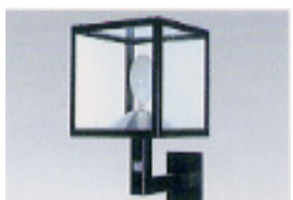
③上向点灯(ブラケット)