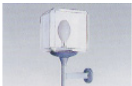
②上向点灯(ブラケット)