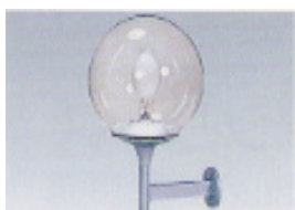
①上向点灯(ブラケット)